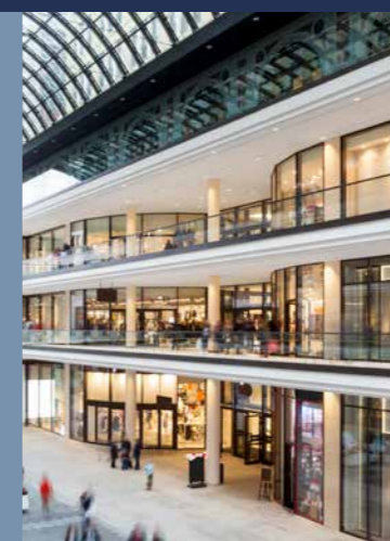
Commerce de détail